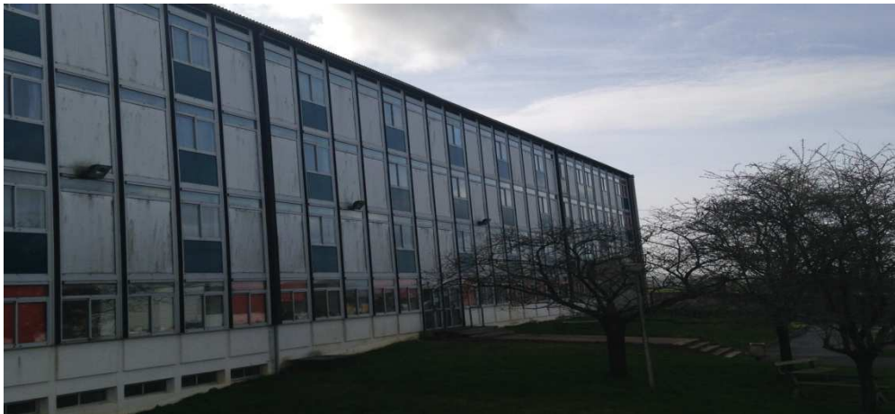
Le bâtiment de l'internat