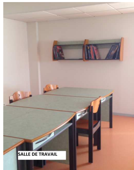
SALLE DE TRAVAIL